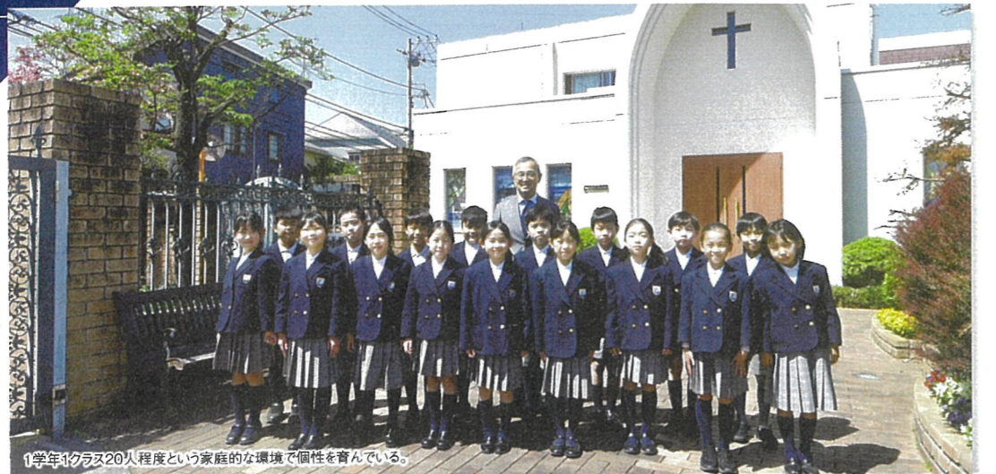
1学年1クラス20人程度という家庭的な環境で個性を育んでいる。