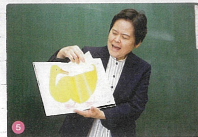
① 外国人教員の授業は週2回。② 毎年実施している国際交流。2025年はフィリピンから。③ 英語の授業はお祈りと賛美歌、暗唱聖句から始まる。④ 海外にルーツを持つ子も多く、国際理解の感覚が自然と養われる。⑤ 教材には絵本も活用。